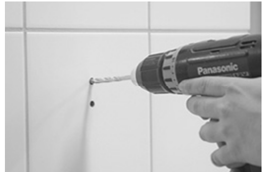
[ Bild 2.] 7 mm borrar endast genom kakel (använd kakelbollar) Våtrumssilikon i hålet.