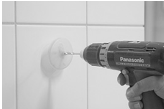
[ Bild 1.] Märk ut önskat läge på detaljen (lämpligast mitt i kakelplattan) förborra genom väggens alla material med 5.5mm borrar typ Wedevåg hårdmetall.

Infästning mot golv får endast ske med lim. (Ej borrning).