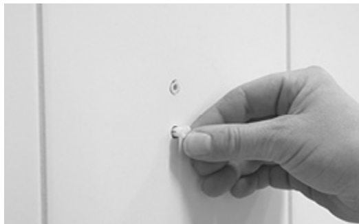
[ Bild 3.] Montera plastplugg avsedd för 5.5mm hål.